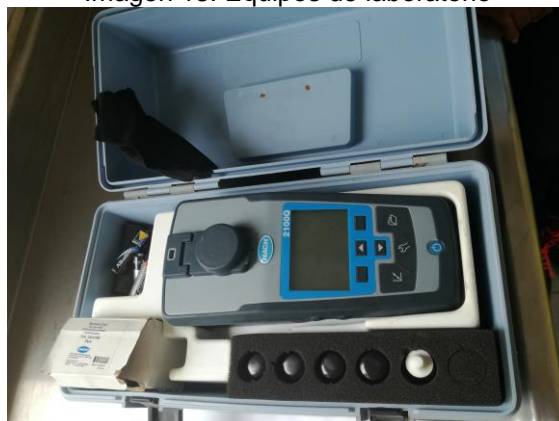
Imagen 13. Equipos de laboratorio