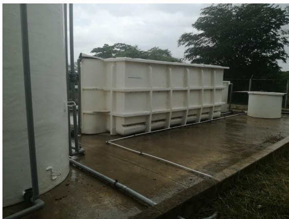
Imagen 16. Planta de tratamiento sector Chancleta