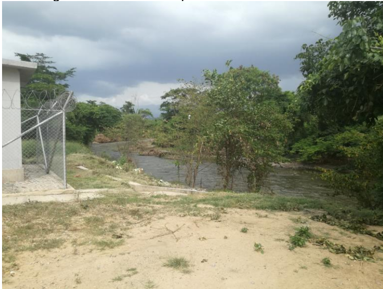
Imagen 3. Sistema de captación lateral Río Ranchería

Actualmente no se realiza la captación lateral del río Ranchería y por tanto no existe conexión a la PTAP.