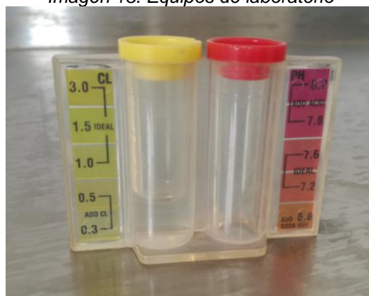
Imagen 13. Equipos de laboratorio