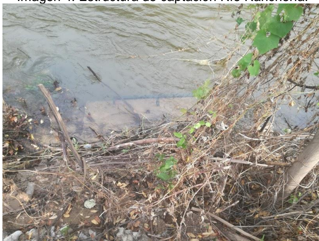
Imagen 4. Estructura de captación Río Ranchería.