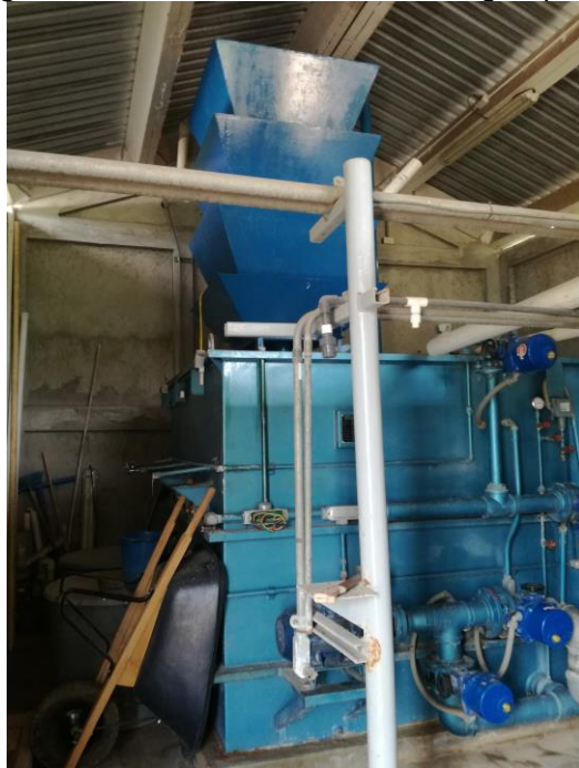
Imagen 6. Planta de tratamiento de agua potable

Las redes de distribución están construidas en tubería PVC y las conexiones domiciliarias en tubería flexible.