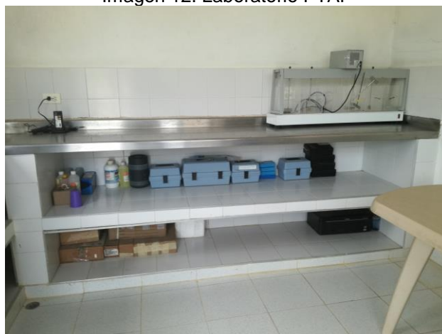
Imagen 12. Laboratorio PTAP

En la visita realizada se pudo evidenciar que el laboratorio se encuentra equipado con el kit básico. Los parámetros de calidad de agua que son evaluados son: Turbiedad y pH. El laboratorio no cuenta con certificación del Ministerio de Salud y Protección Social y ni del Organismo Nacional de Acreditación de Colombia.