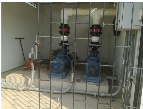
Imagen 5. Cuarto de bombas captación Río Ranchería.