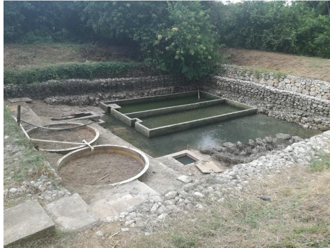
Imagen 14. Sistema de tratamiento de agua residual sector Roche.