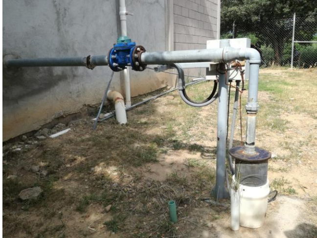
Imagen 2. Captación pozo subterráneo.