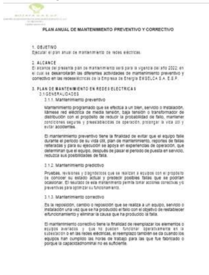
Figura 1. Plan de mantenimiento