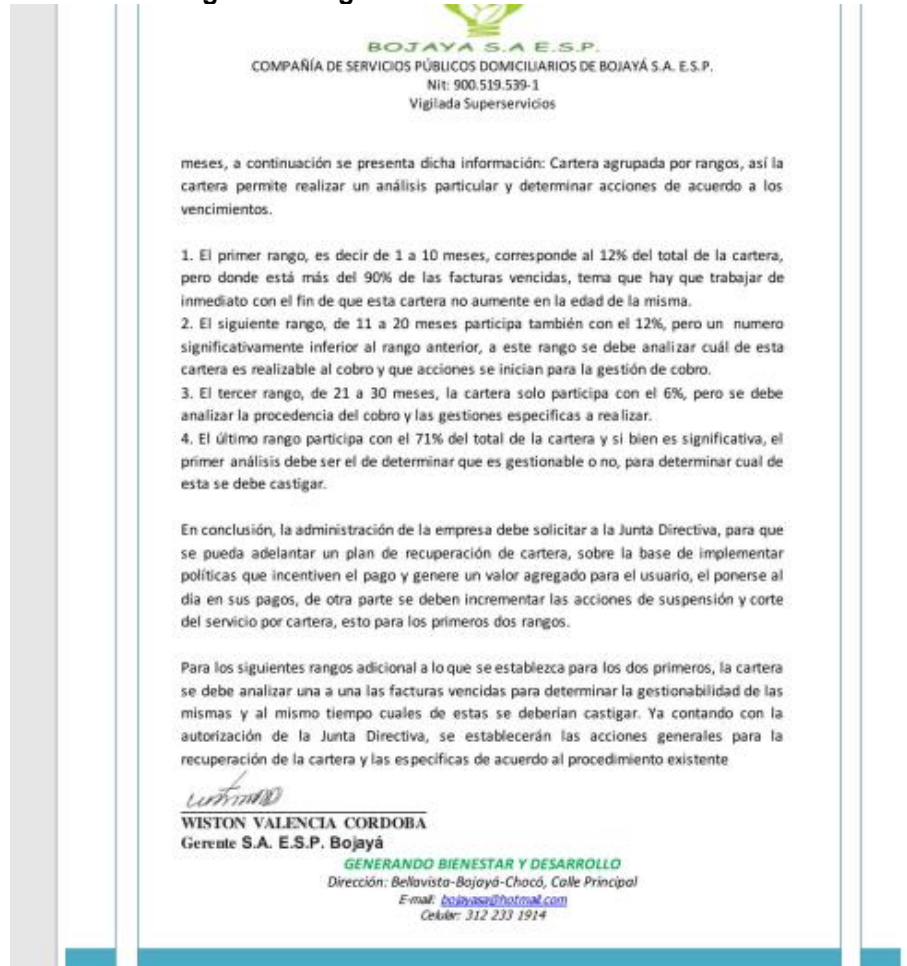
Figura 4. Diagnóstico del estado de la cartera