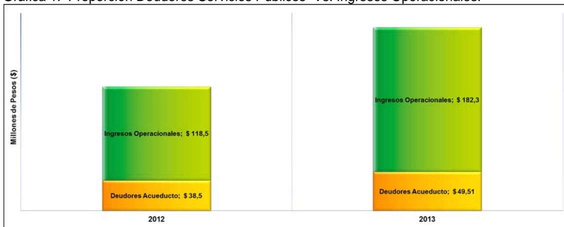
Gráfica 1. Proporción Deudores Servicios Públicos Vs. Ingresos Operacionales.

Como ya mencionamos para el caso de 2012 de $118,5 millones de pesos causados por la prestación del servicio de acueducto $38,5 quedaron pendientes de recaudo, mientras que en 2013 de $182,3 millones facturados quedaron pendientes de recaudo $49,51 millones de pesos, aunque se presenta un crecimiento en la cartera por servicios públicos del 28,4% la proporción de esta frente al total de los ingresos operacionales es menor, lo cual resulta consistente con la mejora presentada en el indicador de rotación de cuentas por cobrar al pasar de 119 días en 2012 a 99 día en 2013.