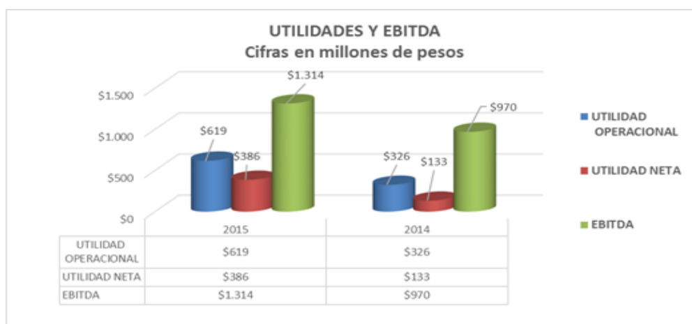
Gráfico 1 – Utilidades y Ebitda