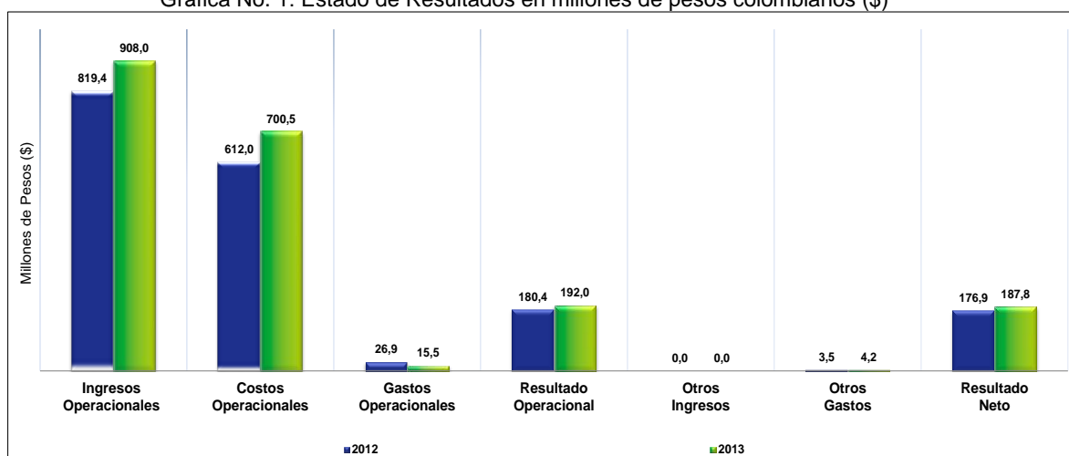
Gráfica No. 1: Estado de Resultados en millones de pesos colombianos ($)

El gráfico a continuación revela que el aumento de los ingresos entre las vigencias y el incremento de los gastos afectó directamente la utilidad operativa para el prestador, lo que permite interpretar un aumento de $10 millones entre los años 2013 y 2014. En consecuencia la utilidad operacional del año 2013 fue de $176,9 millones y aumenta a $187,8 millones de pesos en el año 2014, situación que demuestra un aumento de la eficiencia operacional del prestador.