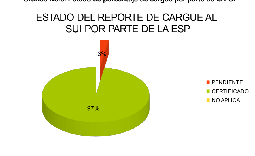
Gráfico No.3. Estado de porcentaje de cargue por parte de la ESP