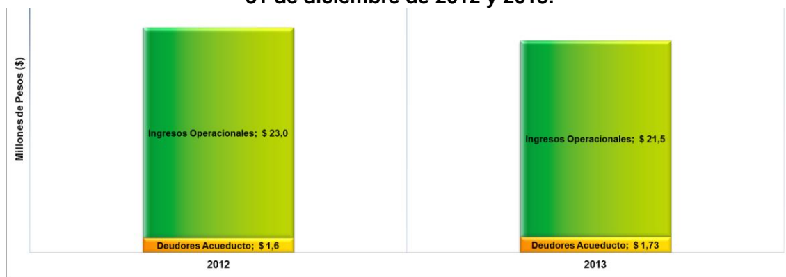
Grafica No. 1. Proporción de Ingresos Operacionales pendientes de Recaudo a 31 de diciembre de 2012 y 2013.

Fuente: Información Financiera reportada al SUI - PUC Anual Consolidado