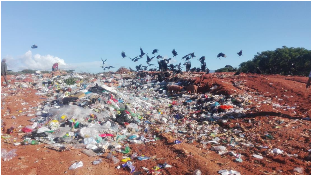
Imagen 2 Sitio de disposición final “Las Tapias”