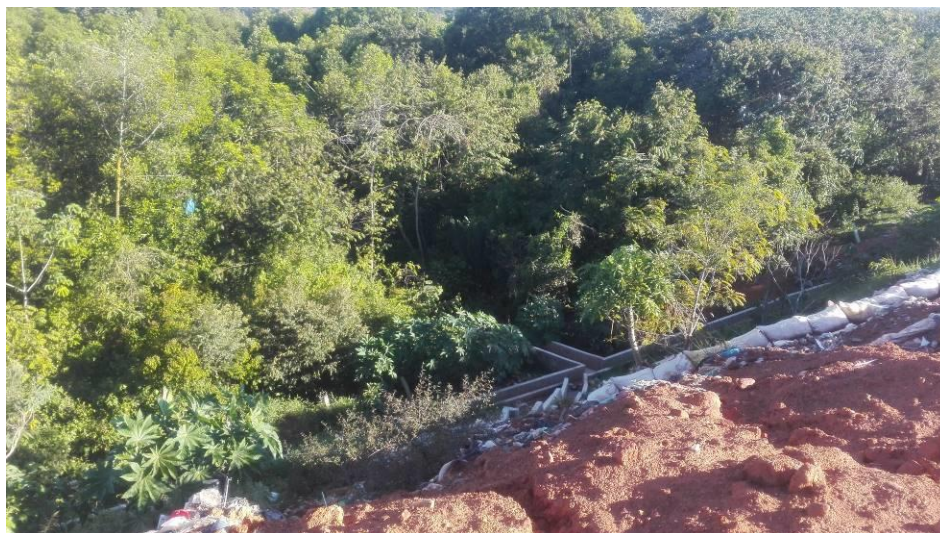
Imagen 12 Canales de aguas lluvia