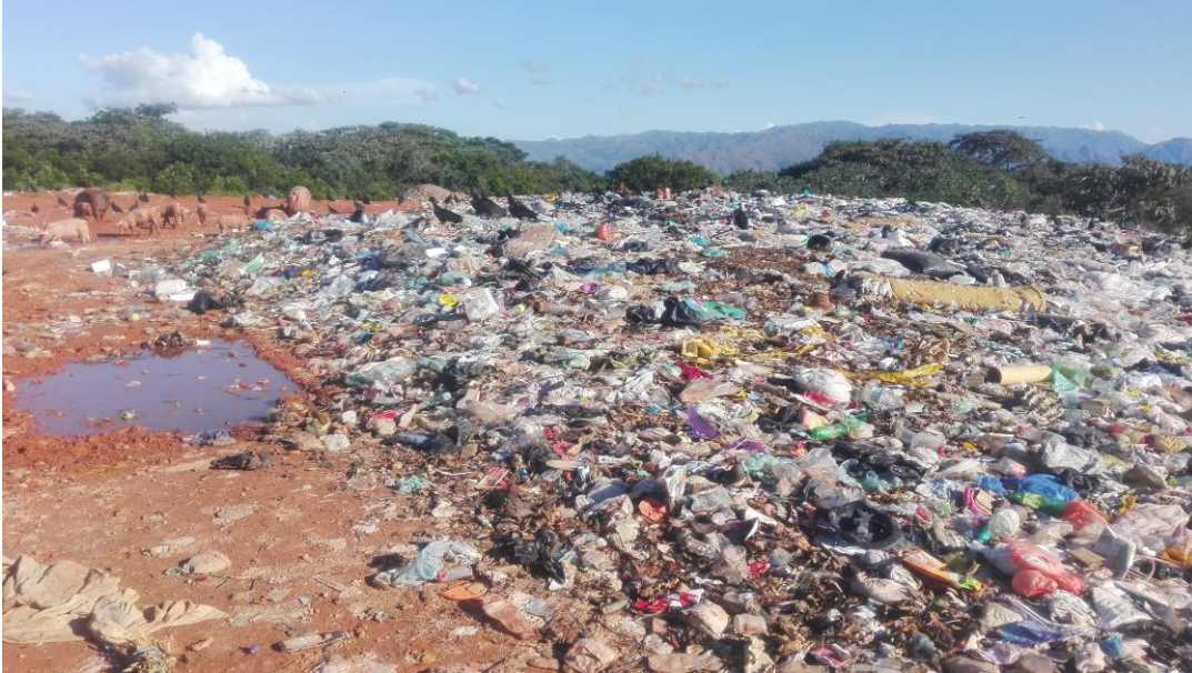
Imagen 8 Frente de Trabajo