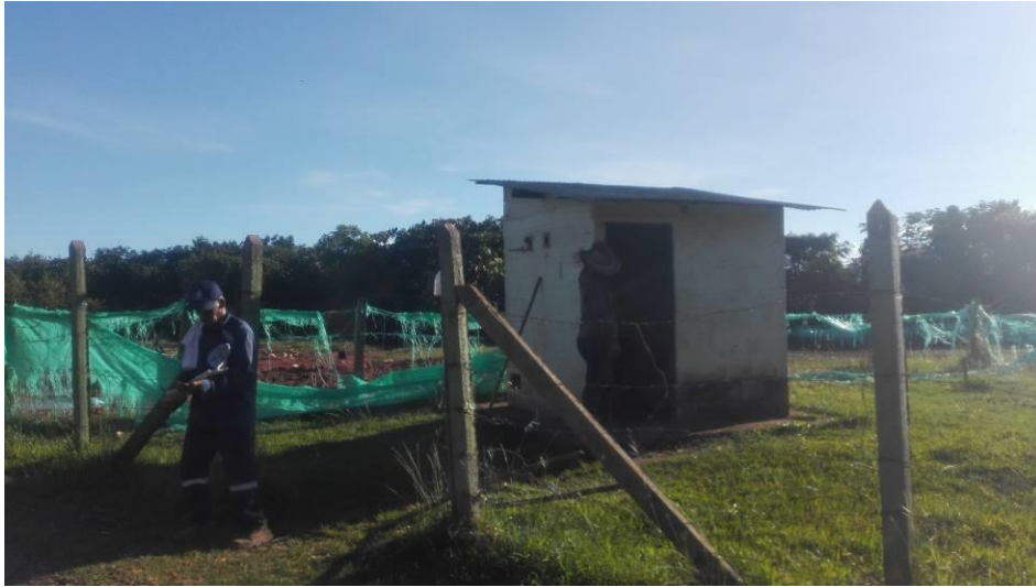
Imagen 16 Guarda de Seguridad