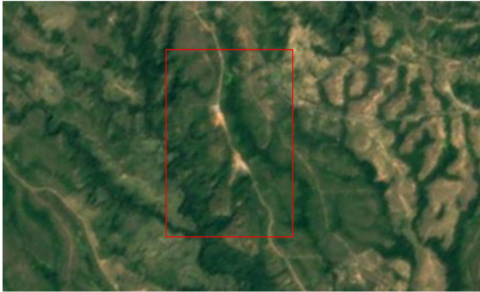
Imagen 1 Sitio de disposición final “Las Tapias”