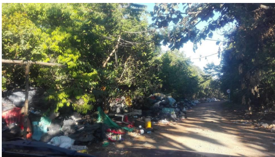
Imagen 4 Vía externa