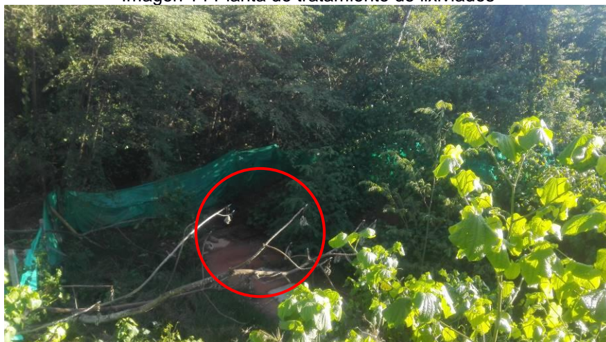
Imagen 14 Planta de tratamiento de lixiviados