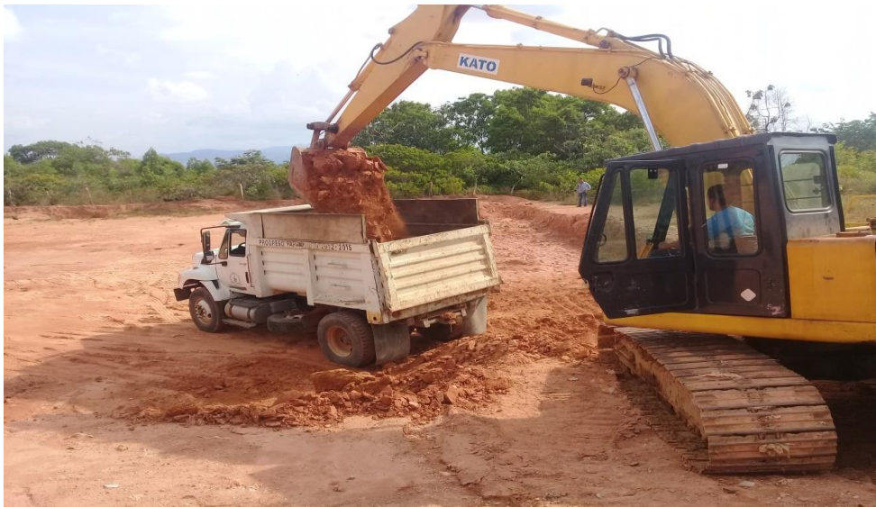
Imagen 17 Retro excavadora KATO HD 700-VII