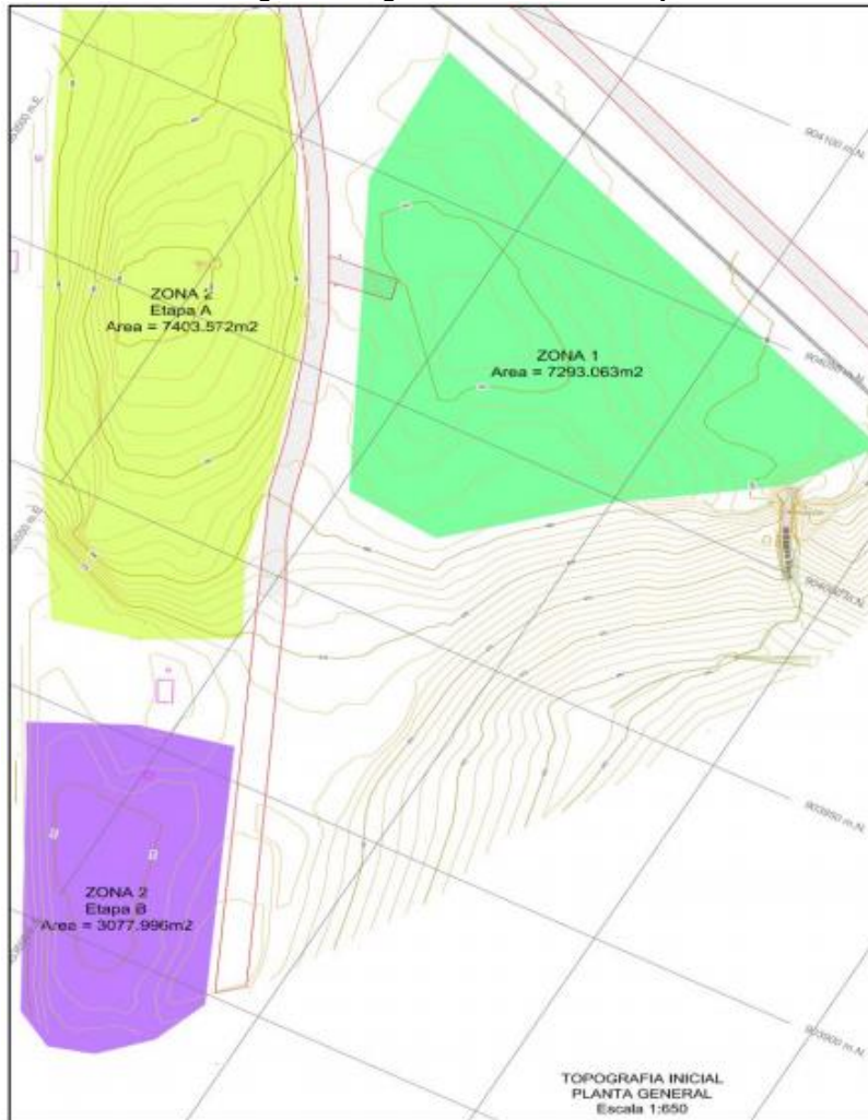
Imagen 9 Diagrama frente de trabajo