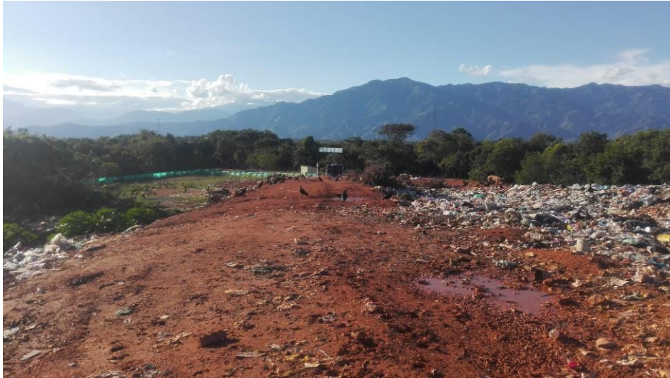
Imagen 5 Vía interna SDF