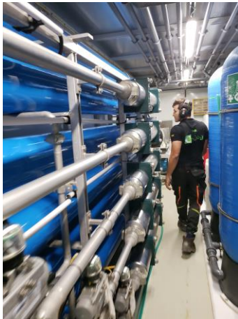
Foto 17. Planta de tratamiento