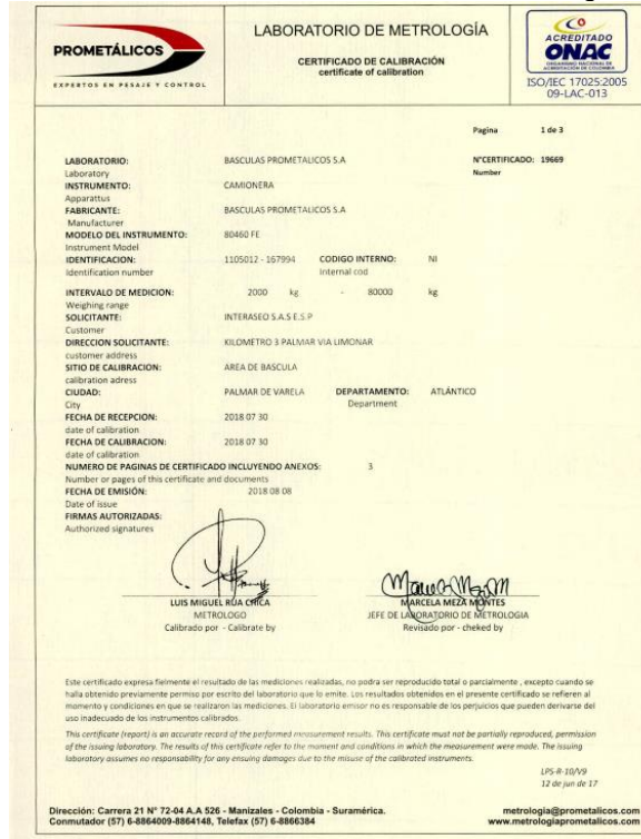
Imagen 3. Certificado de calibración de la báscula entregado en visita