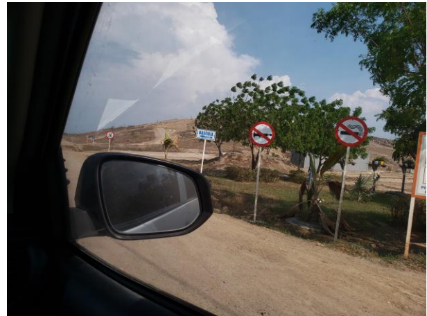
Foto 7. Señalización

Fuente. Registro fotográfico SSPD – Visita abril 2019