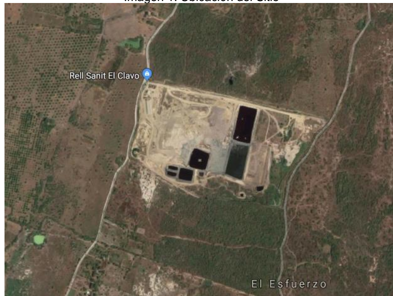
Imagen 1. Ubicación del Sitio

La empresa comenzó a operar el relleno sanitario a partir de mayo de 2011 y por licencia tiene contemplada una vida útil de 30 años, es decir, hasta el año 2041.