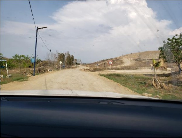
Foto 2. Vía interna parte 1.

Fuente. Registro fotográfico SSPD – Visita abril 2019