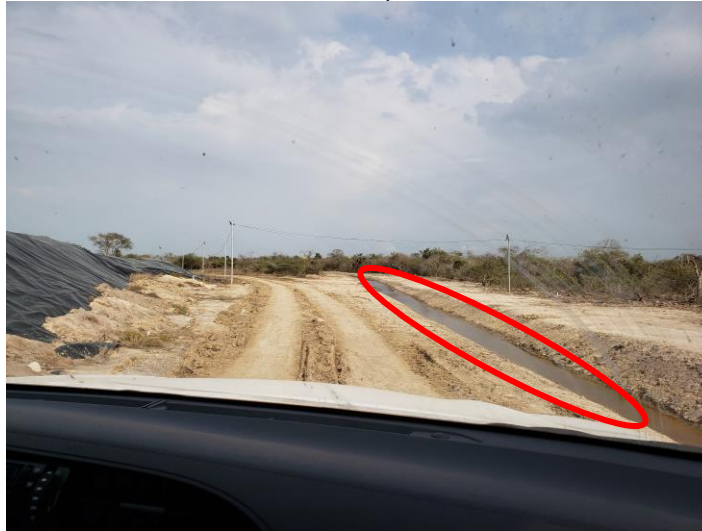
Foto 19. Canales perimetrales.

Fuente. Registro fotográfico SSPD – Visita abril 2019