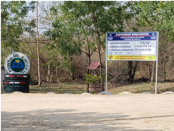
Foto 6. Señal informativa

Fuente. Registro fotográfico SSPD – Visita abril 2019