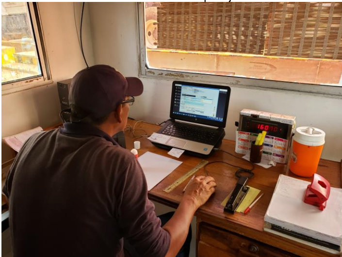
Foto 4. Caseta de pesaje

Fuente. Registro fotográfico SSPD – Visita abril 2019