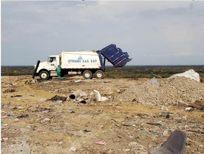
Foto 9. Vehículo descargando residuos en el frente de trabajo

Fuente. Registro fotográfico SSPD – Visita abril 2019