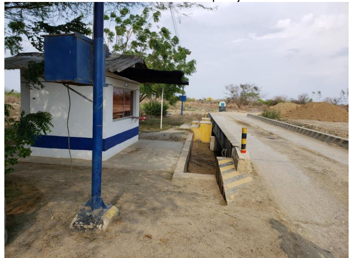
Foto 5. Básculas de pesaje

Fuente. Registro fotográfico SSPD – Visita abril 2019