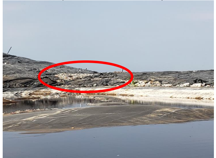
Foto 10. Zona no perteneciente al frente de trabajo sin cobertura

Fuente. Registro fotográfico SSPD – Visita abril 2019