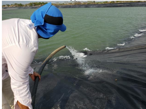
Foto 18. Lixiviado tratado y piscina de almacenamiento

Fuente. Registro fotográfico SSPD – Visita abril 2019