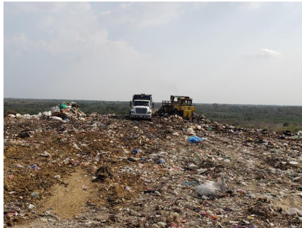
Foto 8. Buldócer realizando labores

Fuente. Registro fotográfico SSPD – Visita abril 2019