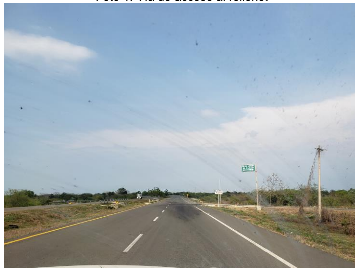
Foto 1. Vía de acceso al relleno.

Fuente. Registro fotográfico SSPD – Visita abril 2019