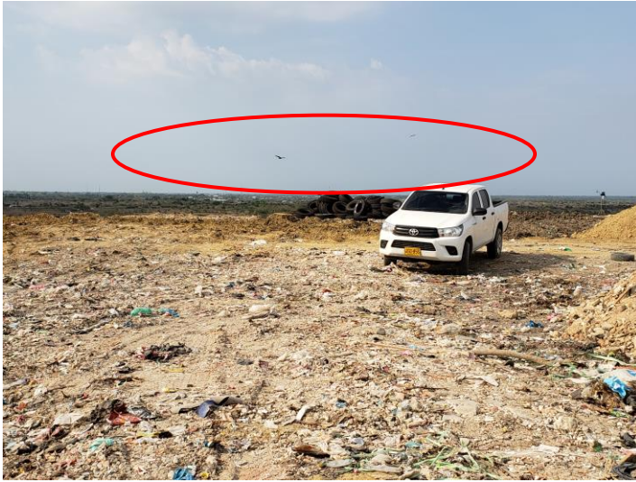
Foto 14. Avifauna sobrevolando