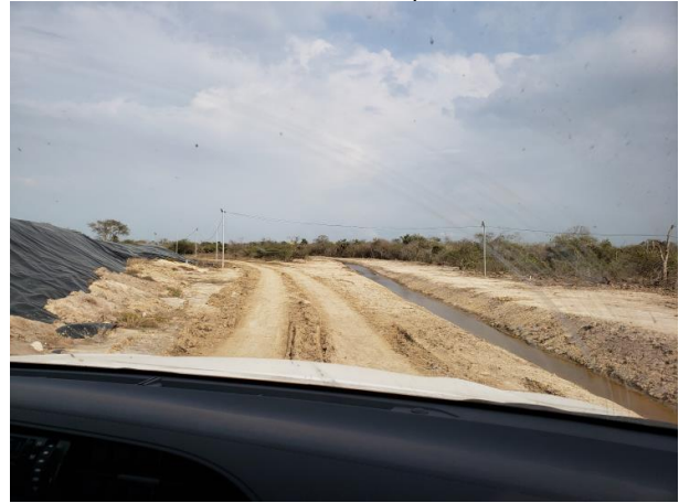
Foto 3. Vía interna parte 2.