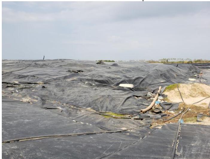
Foto 11. Cubrimiento zona no operativas.

Fuente. Registro fotográfico SSPD – Visita abril 2019