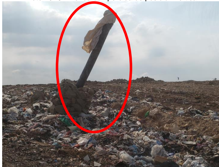
Foto 16. Chimenea con pérdida de posición vertical

Visita abril 2019