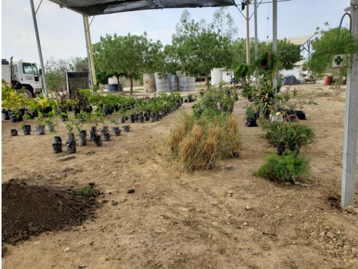
Foto 12. Vivero.

Fuente. Registro fotográfico SSPD – Visita abril 2019