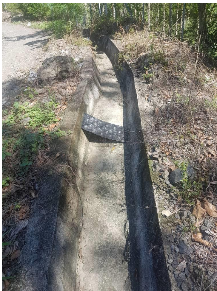
Ilustración 11. Canales de aguas lluvia