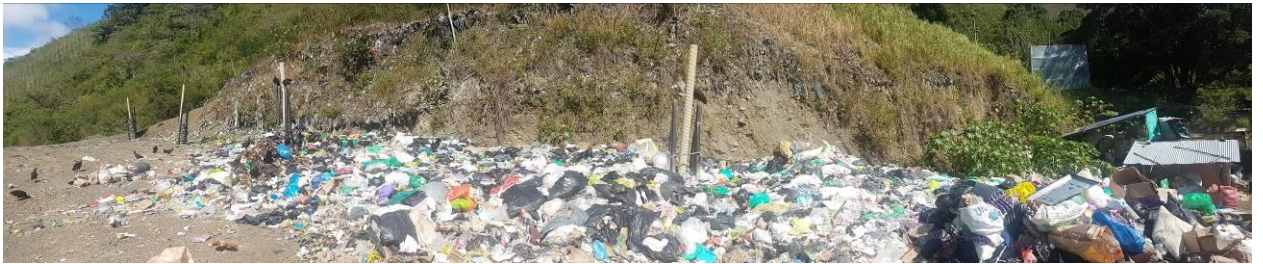
Ilustración 2. “Relleno Sanitario Dabeiba”