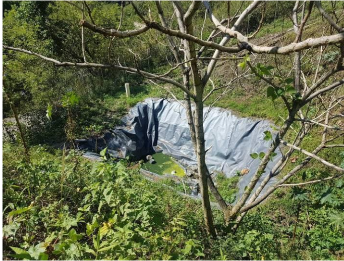
Ilustración 8. Pondaje