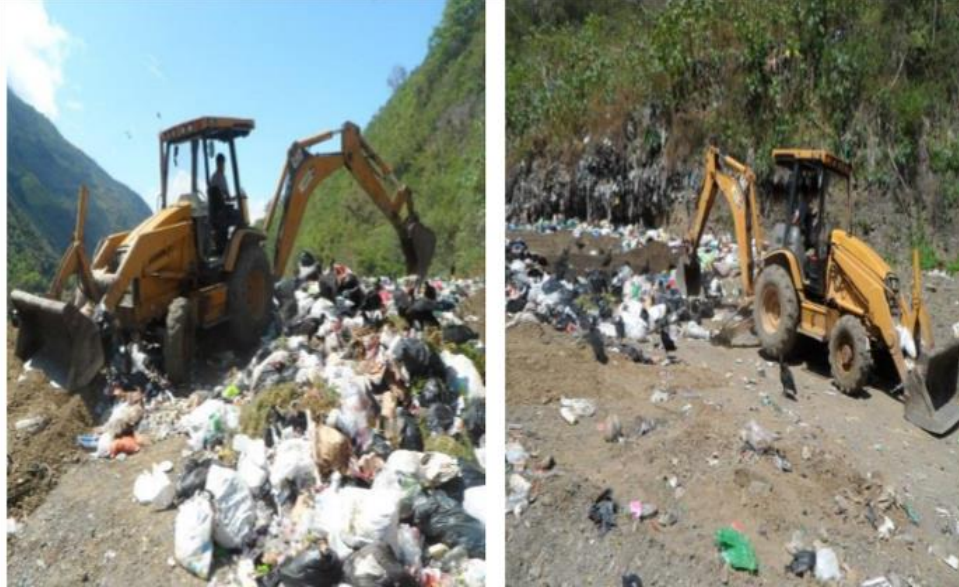
Ilustración 11. Maquinaria