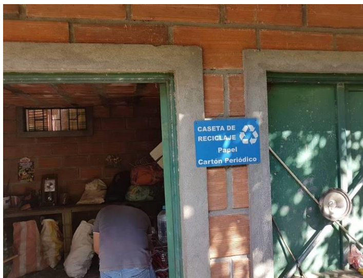
Ilustración 12. Caseta de reciclaje