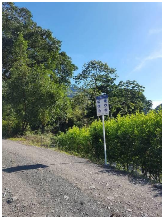
Ilustración 4. Vía interna