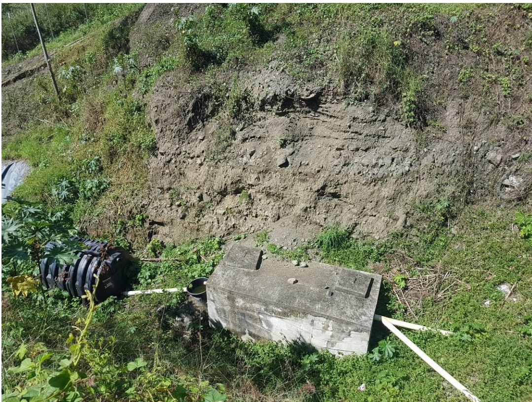
Ilustración 7. Planta de tratamiento de lixiviados