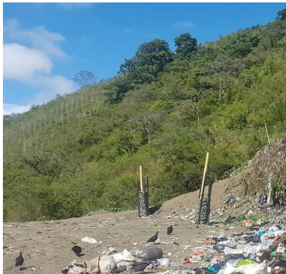
Ilustración 9. Chimeneas