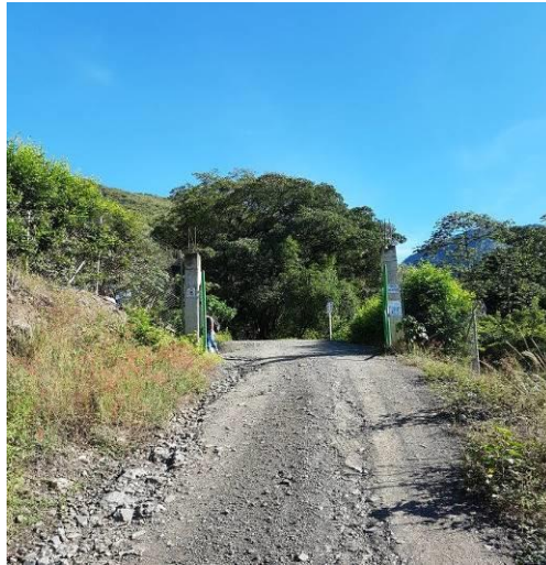
Ilustración 3. Vía externa