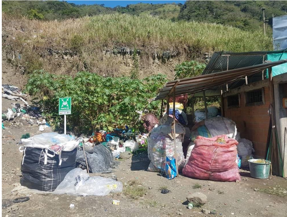
Ilustración 13. Material aprovechable