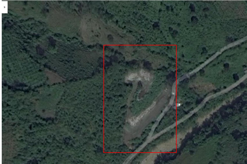
Ilustración 1. “Relleno Sanitario Dabeiba”