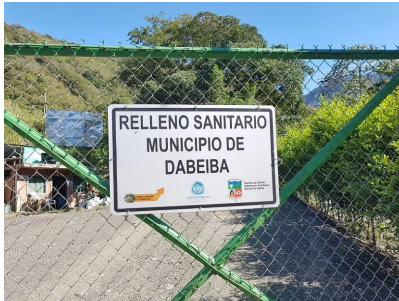
Ilustración 2. Valla informativa