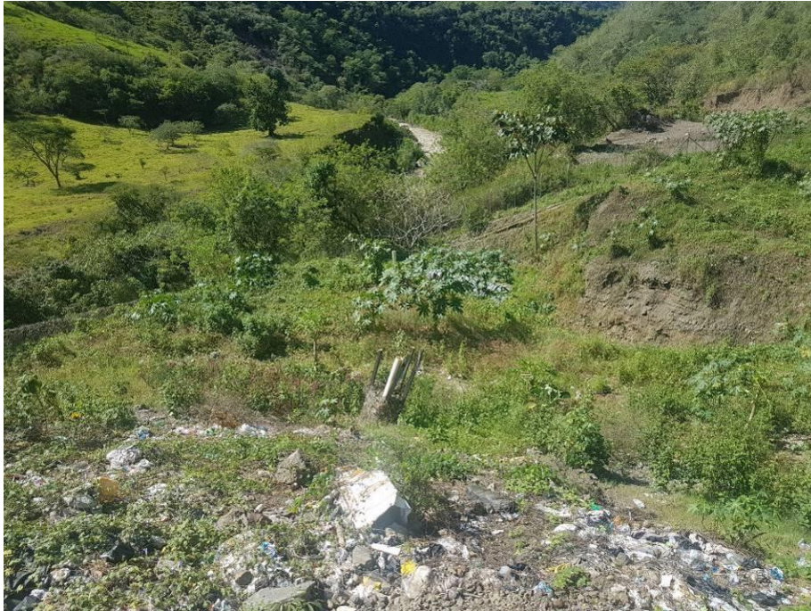
Ilustración 10. Chimenea con pérdida de posición vertical