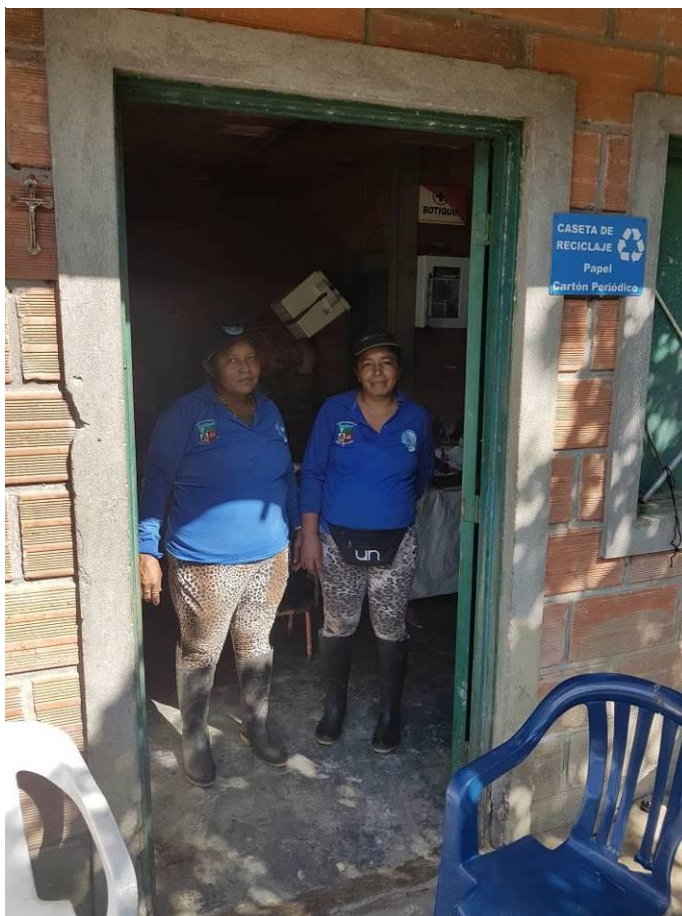
Ilustración 17. Trabajadoras