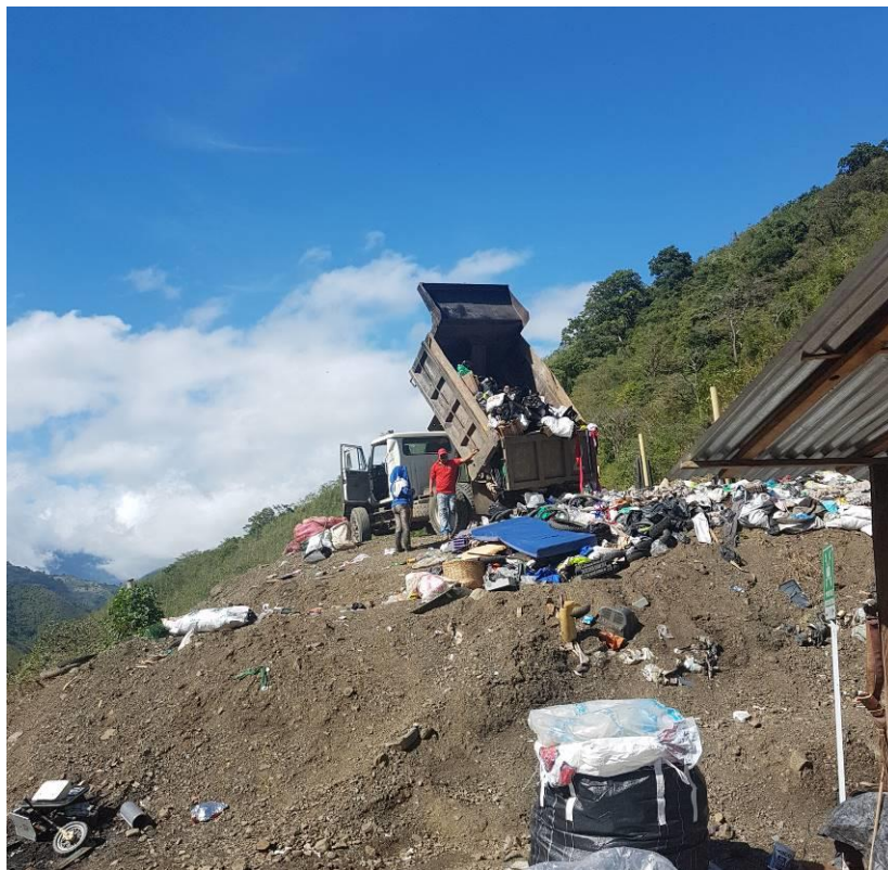
Ilustración 7. Frente de trabajo