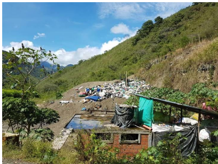
Ilustración 5. Residuos sólidos expuestos