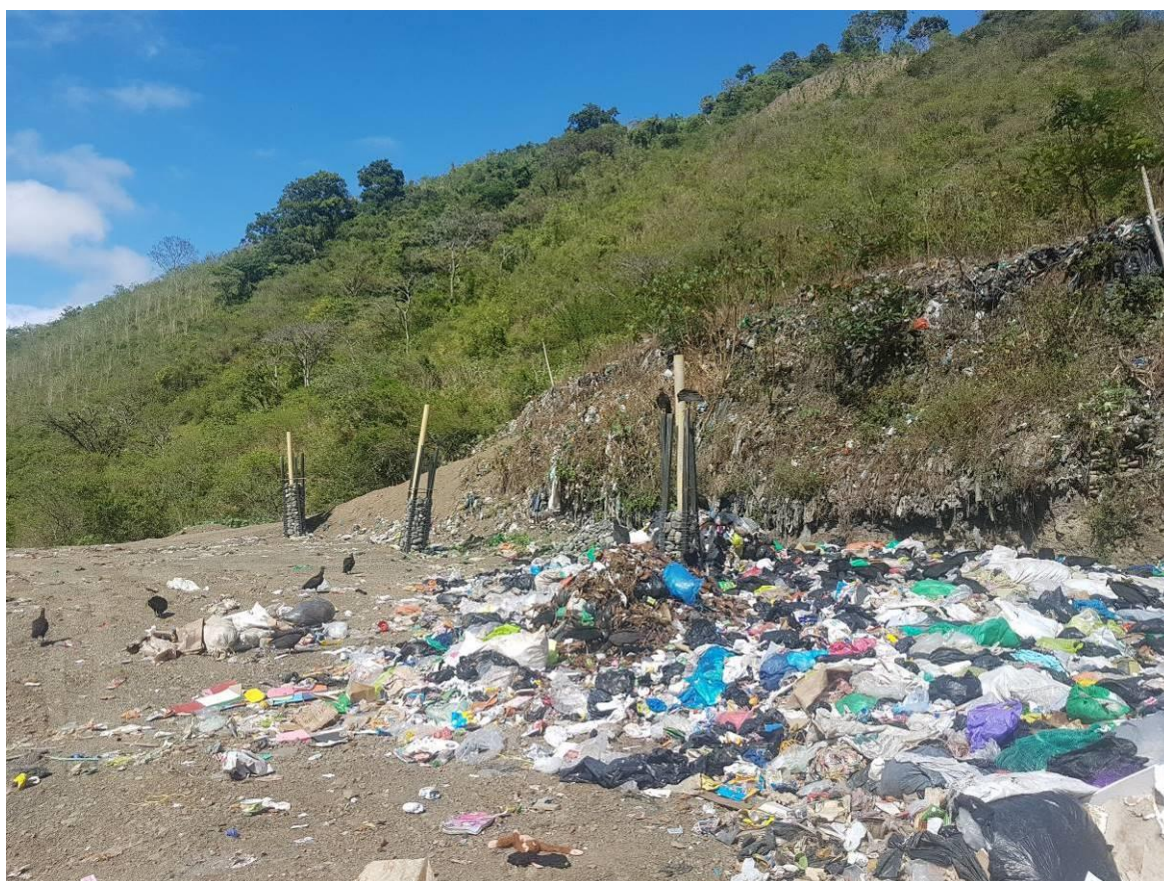
Ilustración 6. Gallinazos