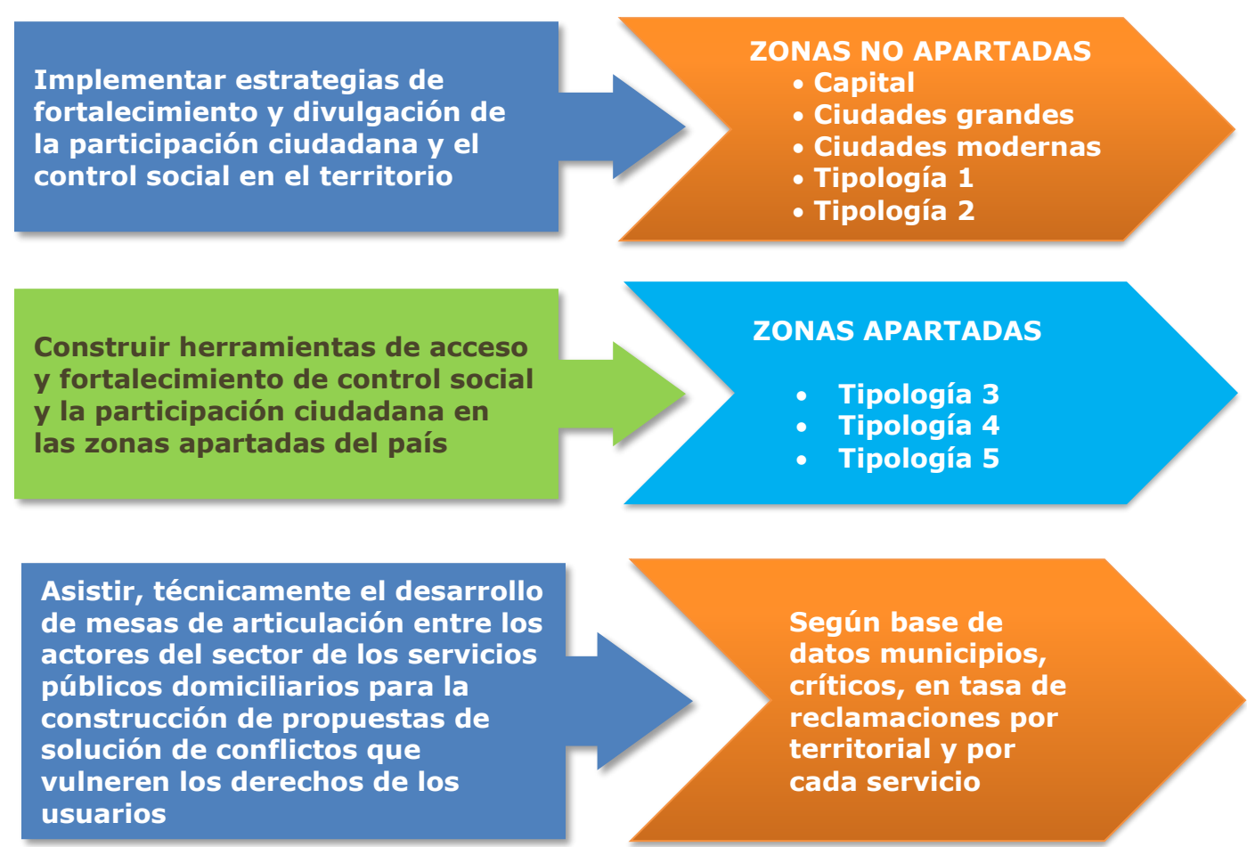
Figura 3. Relación plan de acción y selección municipios

En este orden de ideas, se estableció para el cumplimiento de metas de acuerdo con las actividades de plan de acción 2024 se realice tomando en cuenta la metodología de identificación de tipologías municipales así (Ver Anexo 12.):