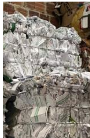
Imagen 6: Material compactado y listo para su comercialización.