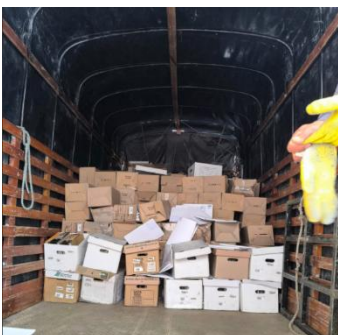
Imagen 1: Recolectación y transporte del material aprovechable.

A continuación, se presenta el registro fotográfico del proceso de recolección, transporte y destrucción del material recolectado, como evidencia del cumplimiento del procedimiento.