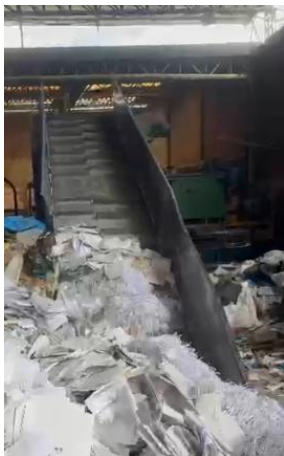
Imagen 4: Destrucción mecánica del material.