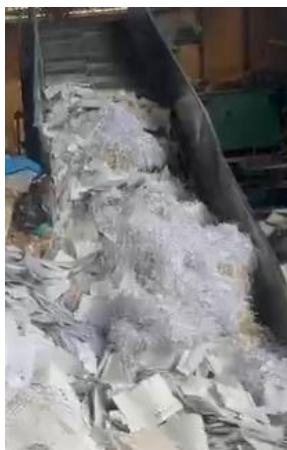
Imagen 5: Proceso de compactación en pacas.