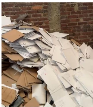
Imagen 2: Recepción del material aprovechable en la ECA.