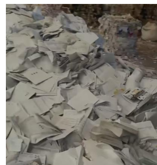
Imagen 3: Separación y clasificación del material aprovechable.