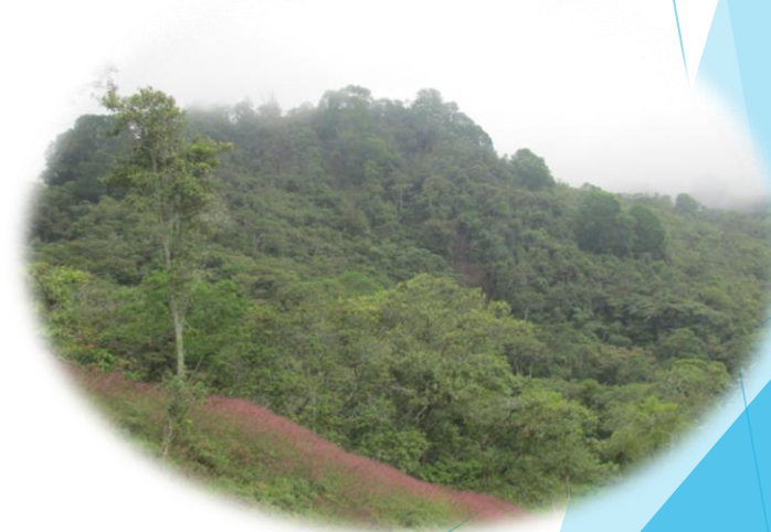
Finca el Lucero. “Humedal la Calichosa”