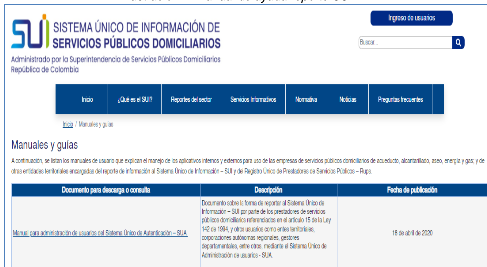
Ilustración 2. Manual de ayuda reporte SUI