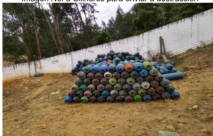
Imagen No. 5 Cilindros para enviar a destrucción

Ahora bien, en relación con el suministro de tanques estacionarios a usuarios finales, la empresa dispone de 3 carro tanques, con una capacidad total de 9.553 Galones de GLP, con base en la información reportada en SUI 1 , con los cuales atiende un total de 204 tanques estacionarios, ubicados en 21 centros poblados de los departamentos de Boyacá y Cundinamarca. Para corroborar lo antes expuesto, en la Tabla No. 15, se encuentra el detalle del tanque de almacenamiento y los carro tanques según lo reportado por la empresa en el "Formato C7. Información de los tanques de