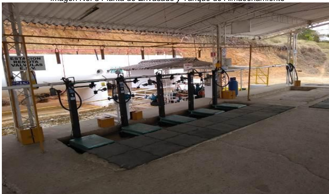
Imagen No. 3 Planta de Envasado y Tanque de Almacenamiento

Posteriormente, se encontró que la empresa también dispone de válvulas de corte de emergencia y/o cierre de sección en el sistema de trasiego, que están conectadas al tanque de almacenamiento, necesarias para la seguridad del módulo de cargue y descargue. Los interruptores generales de los circuitos para bombas, compresores y red