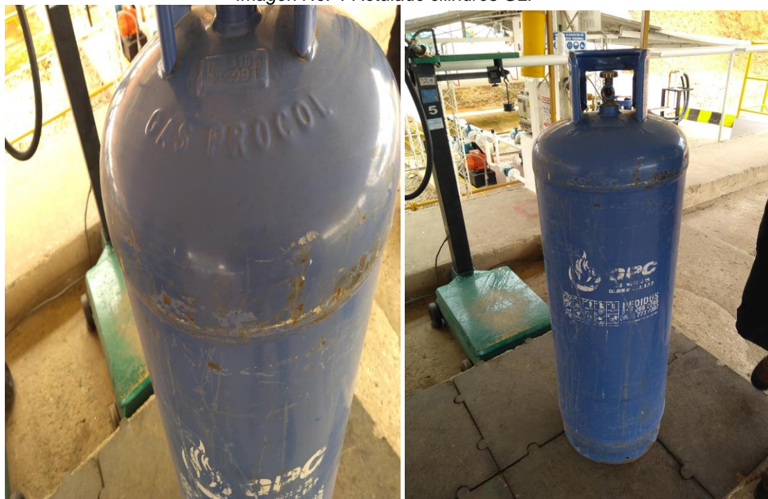
Imagen No. 4 Rotulado cilindros GLP

En cuanto al proceso de llenado, se evidenciaron 5 básculas mecánicas, debidamente calibradas el día 18 de septiembre de 2017, de las que se verificó su funcionamiento, con la realización de una prueba, llenando uno de los cilindros, partiendo del peso vacío del mismo (TARA). Así mismo, se identificó la existencia de un patrón masa, utilizado para la verificación de las básculas por parte del prestador.