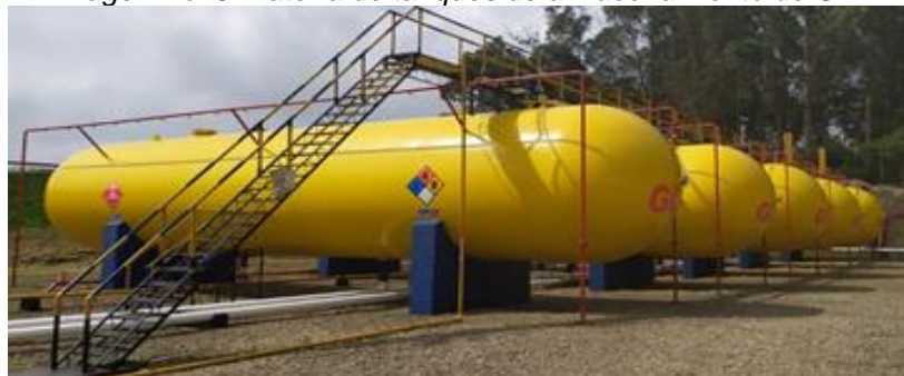
Imagen No. 5. Batería de tanques de almacenamiento de GLP

Se identificó la existencia de 5 tanques de almacenamiento de GLP, ubicados horizontalmente y dispuestos en una sola batería, como se observa en la Imagen No. 5: