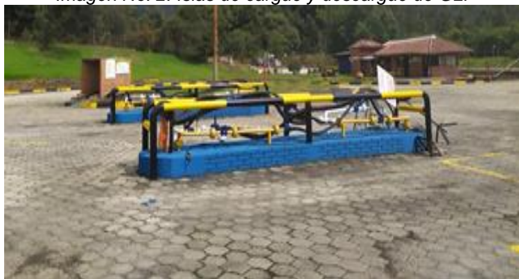
Imagen No. 2. Islas de cargue y descargue de GLP

Igualmente, se pudo observar que existe un espacio amplio de maniobra, en el área de acceso a la báscula y la salida de esta, hacia el área de la isla de cargue y descargue del producto, cumpliéndose el requisito establecido en el numeral 6.3.1.4 de la Resolución 40246 de 2016, de acuerdo con el cual: “En todas las plantas, las áreas de acceso y desplazamiento de los carrotanques y cisternas, deben ser diseñadas y construidas en forma tal, que cuenten con un espacio amplio de maniobra.”