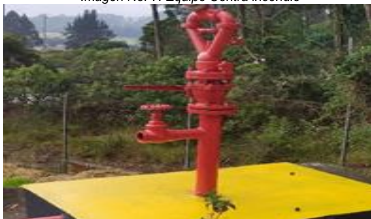
Imagen No. 7. Equipo Contra incendio

La Planta de almacenamiento de GLP, está equipada con un equipo protección contra incendio, de conformidad con el requisito exigido en el artículo 6.3.10 de la Resolución 40246 de 2016, como se ve en la Imagen No. 7; el equipo contra incendio (tubería color rojo) fue probada durante la visita técnica, verificándose su correcto funcionamiento.