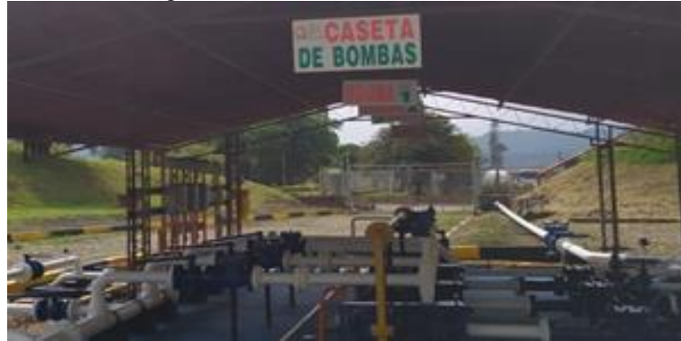
Imagen No. 4. Caseta de bombas de GLP

La caseta de bombas cuenta con tres bombas y un compresor, como también se ve en la Imagen No. 4, cuyas características de capacidad y potencia, fueron reportadas para 2018 en el SUI, en el formato C.6. Sistemas de Bombeo; y C.8. Información de activos de bombas o compresores, como se relaciona a continuación en la Tabla No. 15: