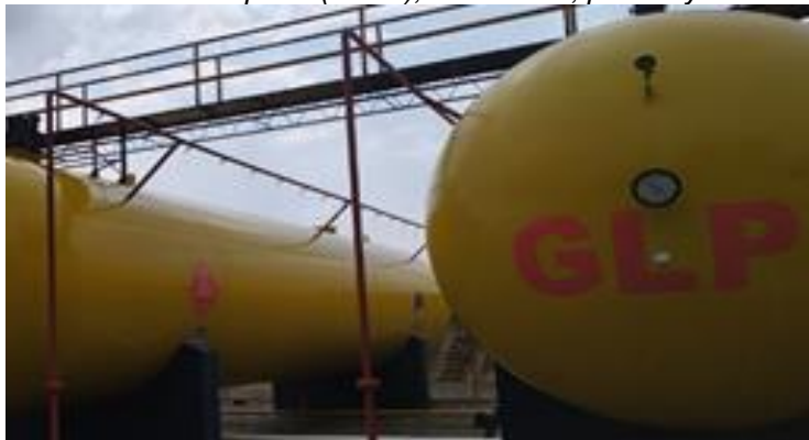
Imagen No. 6. Estructura de soporte (silleta), accesorios, pintura y marca de los tanques

Igualmente, el sistema de almacenamiento posee válvulas de corte de emergencia y/o cierre de sección en el sistema de trasiego, necesarias para la seguridad de módulo de cargue y descargue, en cumplimiento de lo señalado en el literal b) del numeral 6.2.1.4, del artículo 6 de la Resolución 40246 de 2016.