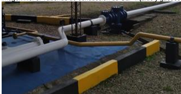
Imagen No. 3. Tuberías de conducción de GLP líquido y gaseoso

De igual manera, se advirtió que el color de las tuberías, se ajusta a lo indicado en el literal c) del numeral 6.2.2.1, del artículo 6, en el que se establece que la fase líquida del GLP, se debe pintar de color blanco; y para la fase gaseosa, de color amarillo.