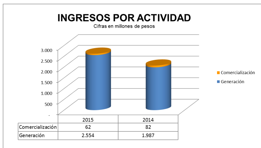
Figura 1 Ingresos por Actividad

Los ingresos operacionales corresponden a las actividades de comercialización y generación, estos para diciembre de 2015 fueron de $2.789 millones, presentando un aumento del 24.45% con respecto a diciembre de 2014, su detalle es mostrado en la siguiente tabla.