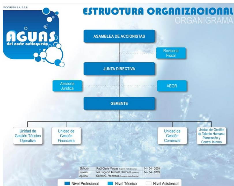
Gráfica 1. Organigrama empresarial

A continuación, la representación grafica de la estructura de la empresa.