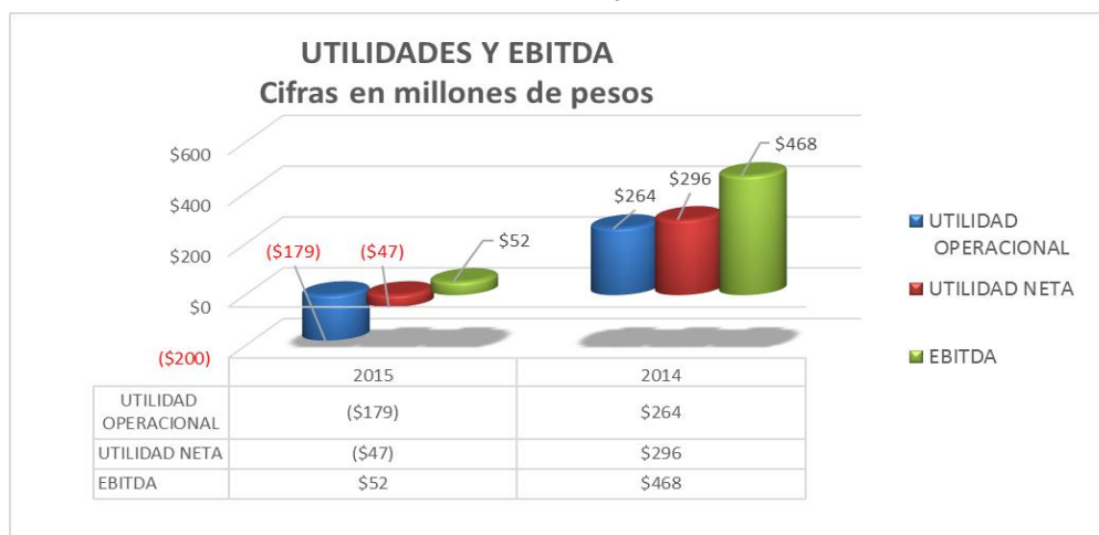
Grafica 1- Utilidades y EBITDA

Como consecuencia, en el año 2015 la empresa generó pérdida del ejercicio de ($47.110.699), mientras que en el año 2014 obtuvo una utilidad de $295.629.292