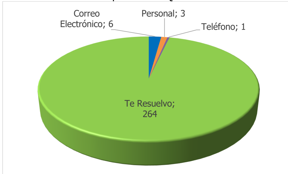
Gráfica 2: Canal de recepción de las QRSF cuarto trimestre 2019