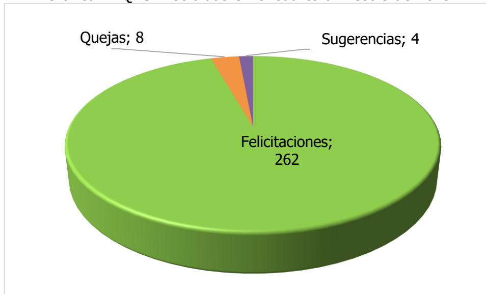
Gráfica 1: QRSF recibidas en el cuarto trimestre de 2019

De la gráfica anterior se puede observar que el 95.6% de las QRSF fueron felicitaciones recibidas, en su mayoría por la excelente atención de los Gestores en los Puntos de Atención Superservicios, además de conocimiento y manejo de los temas y soluciones en primer contacto, lo cual indica que se está brindando un trato más ameno y cálido al ciudadano.